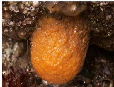
Une orange de mer