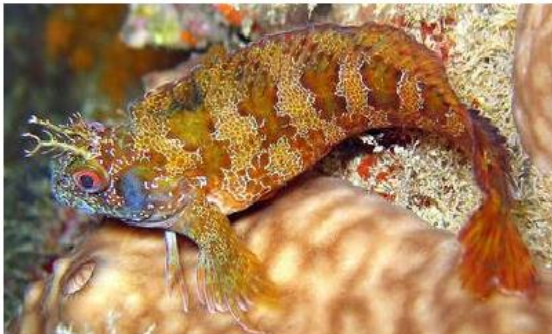
la blennie baveuse