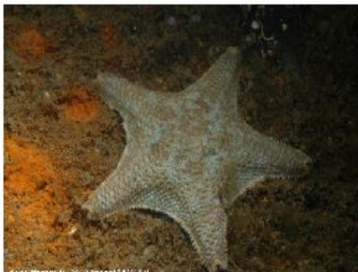
l'astérie ou étoile de shérif!