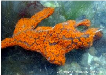
les botrylles étoilés, sous les pierres également